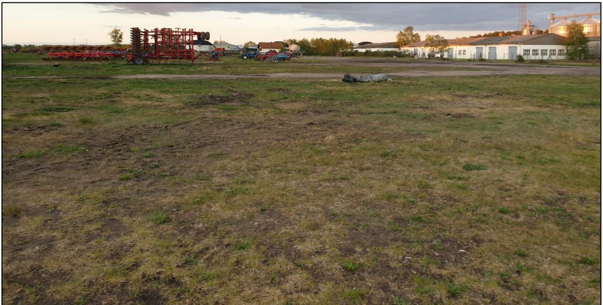
Abbildung 1: Blick nach Norden über den Planungsraum

Entlang der Landesstraße befindet sich ein 2 m hoher Erdwall. Östlich des Planungsraums schließt die Biogasanlage an den Geltungsbereich. Der zentrale Bereich unterliegt einer regelmäßigen Mahd. Der nördliche Bereich des Planungsraums wird derzeit intensiv landwirtschaftlich bewirtschaftet.